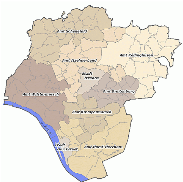
Karte 1 Kreis Steinburg